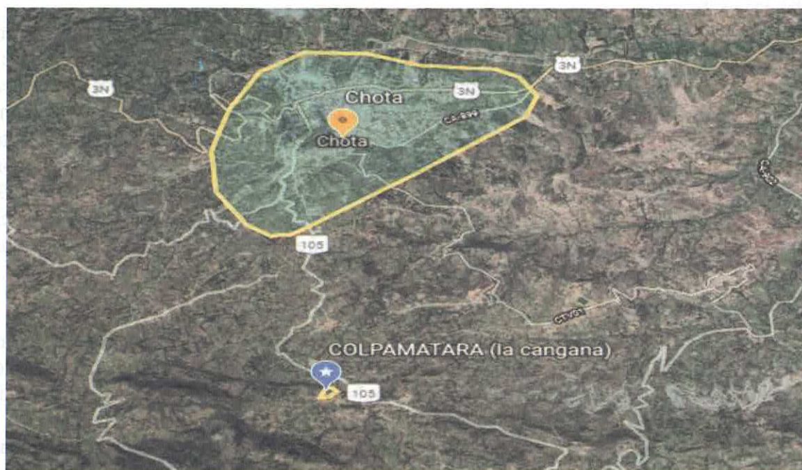
Figura 1. Ubicación GPS de recolección de S. serícea (Google earth, 2020)

Fue realizada una deshidratación parcial bajo sombra a temperatura ambiente, por 10 días. Luego se deshojaron manualmente por roce entre ramas.